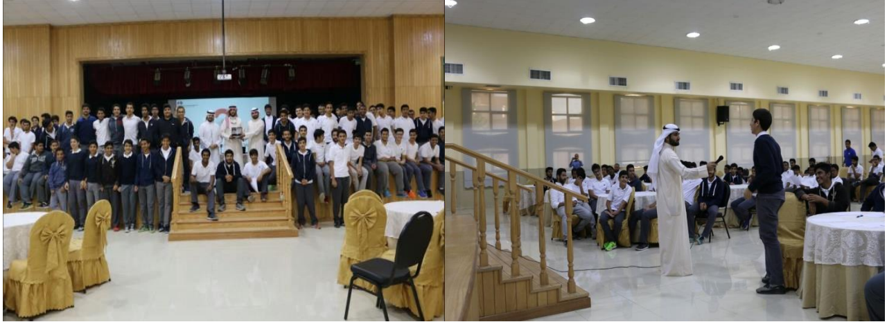
جانب من الزيارات الاسبوعية لمدارس المرحلة الثانوية - البنين