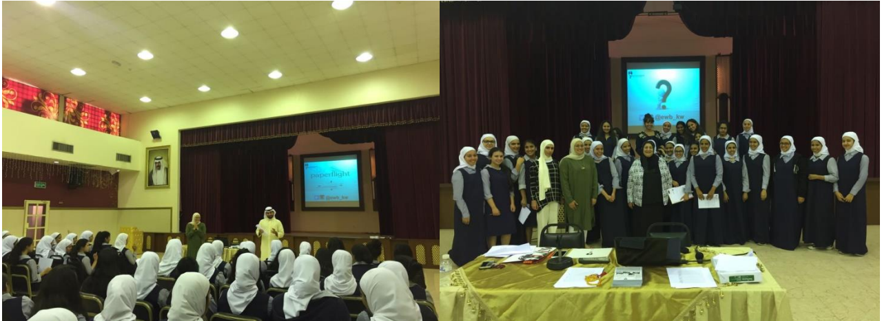
جانب من الزيارات الاسبوعية لمدارس المرحلة الثانوية - بنات