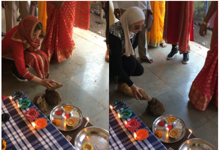
صورة ( ٢ )

الصورة ( ٢ ) تشير إلى إحدى اعادة المتبعة عند افتتاح أي مشروع جديد في الهند ، تم تلبية دعوة أصدقائنا في الهند لمشاركتهم عاداتهم عند افتتاح المشروع ، جاء ذلك من حرص مهندسون بلا حدود – الكويت على التعايش و التسامح و قبول الآخر و احترامه .