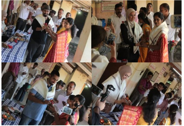
صورة ( ١ )

الصورة ( ١ ) تشير إلى تكريم الفريق المشارك بتنفيذ و افتتاح مشروع قرية مال من قبل إدارة المدرسة ، و حرصت مهندسون بلا حدود – الكويت على احترام عادات و تقاليد أصدقائنا في الهند المتبعة عند افتتاح أي مشروع جديد و كان ذلك من مبدأ احترام الثقافات الأخرى .