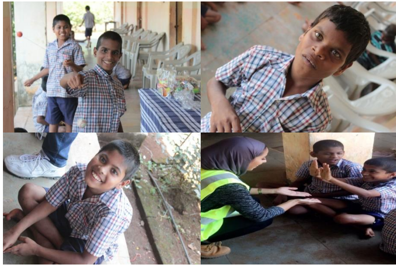
بعض طلبة المدرسة

ابتسامة الأطفال كانت المردود الحقيقي بعد انجاز المشروع و هو ما نسعى إليه في مهندسون بلا حدود - الكويت ، هدفنا هو تغيير حياة الانسان للأفضل عن طريق الاستفادة من خبراتنا و تخصصاتنا لتطبيق الحلول الهندسية التي تحل مشاكل يعانون منها و تحسين جودة حياتهم للأفضل ، كان المشروع عبارة عن تجربة انسانية و هندسية في نفس الوقت ، تخطينا فيه كل الحواجز و وضعنا كل خبراتنا و جهودنا لخدمة الانسان .