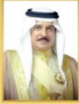
حضرة صاحب الجلالة الملك حمد بن عيسى آل خليفة ملك مملكة البحرين حفظه الله ورعاه