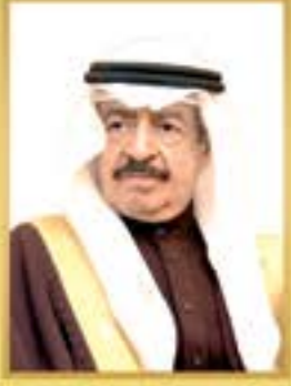
صاحب السمو الملكي الأمير خليفة بن سلمان آل خليفة رئيس الوزراء الموقر حفظه الله ورعاه