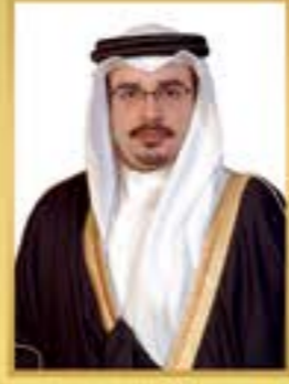
صاحب السمو الملكي الأمير سلمان بن حمد آل خليفة ولي العهد نائب القائد الأعلى النائب الأول لرئيس مجلس الوزراء حفظه الله ورعاه